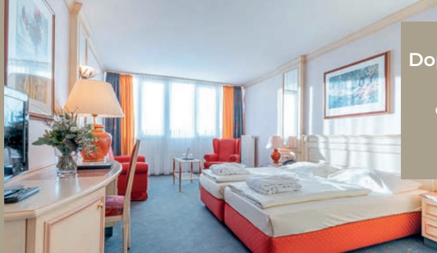
Doppelzimmer Comfort ca. 30 qm ab 169,-€

Our 310 hotel rooms, in various categories, are spread over more than 6000 sqm of hotel space and 5 floors. The comfortable and classically furnished rooms and suites are equipped, among other things, with bath/shower and WC, hair-dryer, telephone, Internet connection and Flat TV. Some rooms have balconies overlooking the courtyard, garden or pool, and some also have air conditioning, walk-in closet and coffee & tea station. All rooms and floors are accessible via three elevators distributed throughout the building. Wi-Fi can be used free of charge throughout the house