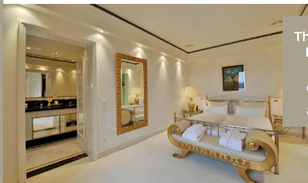
The Monarch IMPERIAL SUITE ca. 60 qm ab 366,-€