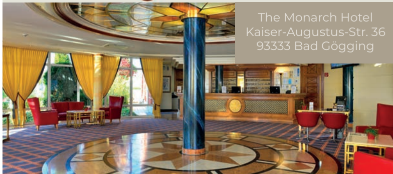
The Monarch Hotel Kaiser-Augustus-Str. 36 93333 Bad Gögging

Arrive & feel good - we welcome you to our 4 star superior hotel „The Monarch“. Actively explore the surroundings, relax and sweat in the sauna area or simply have a successful meeting - this and much more awaits you in our hotel. In this brochure you will find special arrangements, seasonal offers or feel-good moments that we have put together for you. If you have any questions, please feel free to contact us at any time. Furthermore, we invite you to visit our website or browse our social media channels. We wish you a lot of fun!